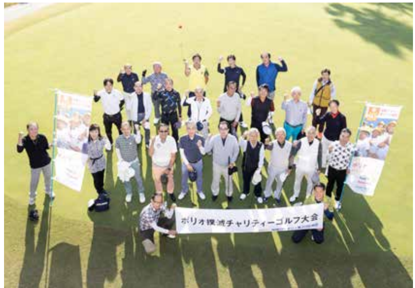
チャリティーゴルフ例会 —— ポリオ撲滅のためのチャリティーゴルフ