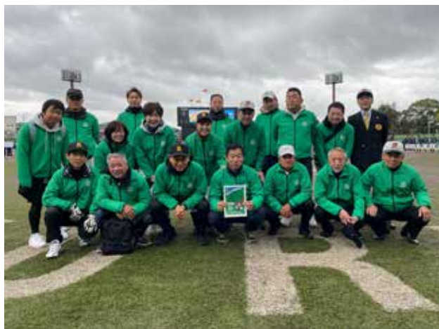
久留米市野球場 野球感謝祭