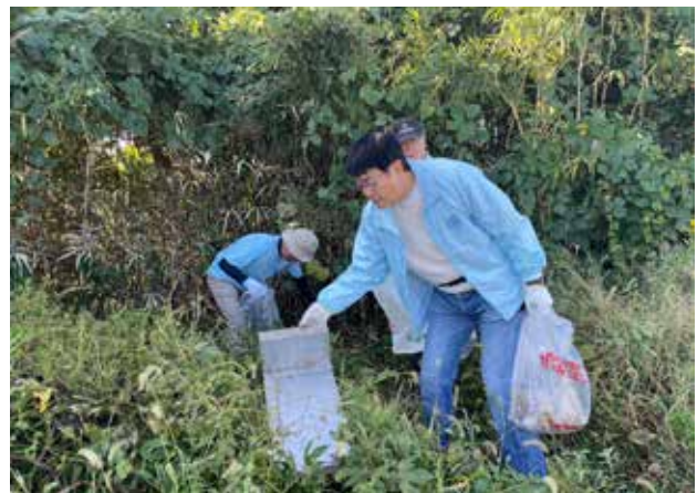
宝満川ノーボイ運動(宝満川一斉清掃で頑張る) 2023年10月22日