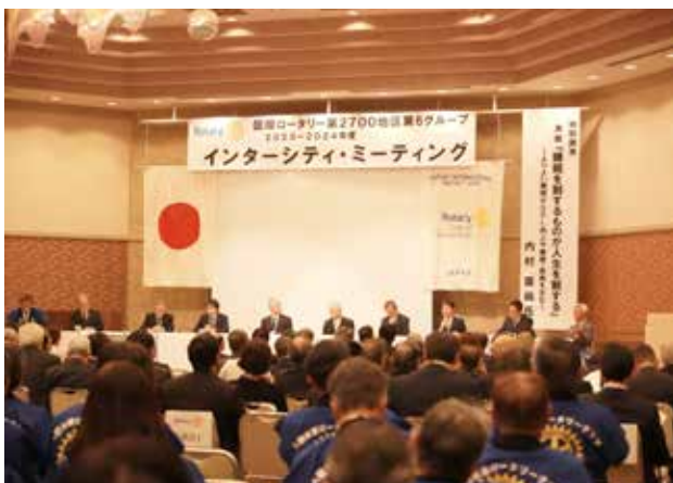
第6グループ IM (2024年2月3日)

社会福祉法人久留米市社会福祉協議会への お米寄贈 など、地元社会への貢献活動も積極的に行っています。