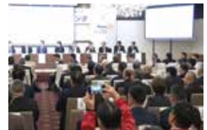
第2部 パネルディスカッション