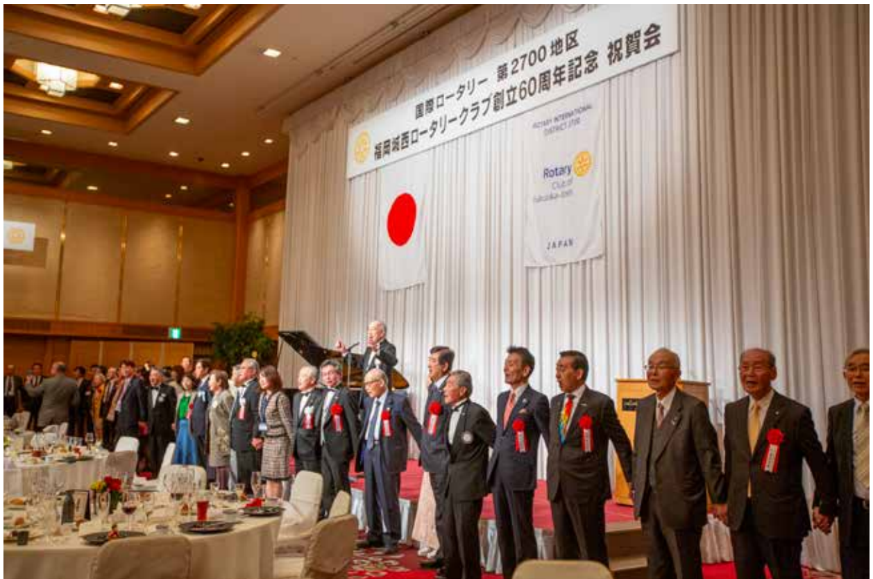
ロータリーソング 手に手つないで

粛々と進められた記念例会となごやかな雰囲気に包まれた記念祝賀会が無事に終了し、当クラブの歴史を飾る1ページとして参加者の記憶に刻まれたことと思います。