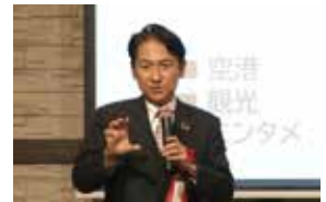
武内和久北九州市長