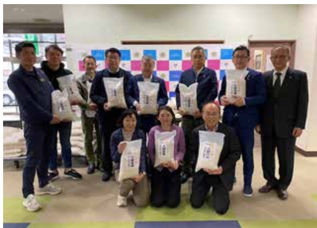
久留米市社会福祉協議会へ米寄贈 (2024年2月14日)