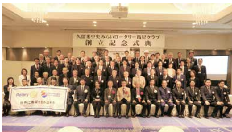
久留米中央みらいロータリー衛星クラブ 創立記念式典