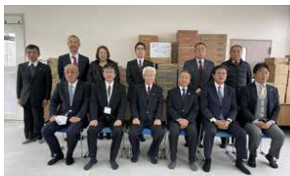
フードバンク事業