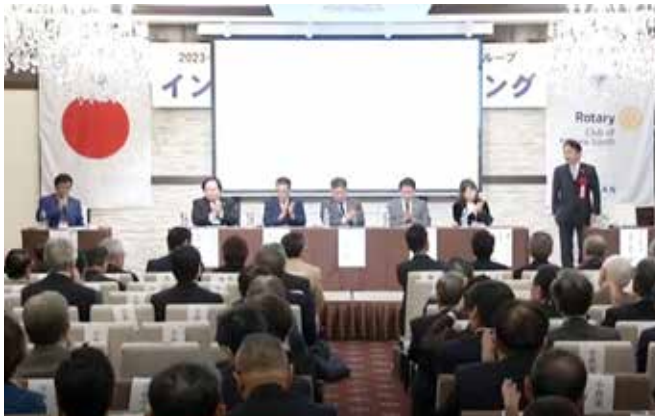
第1部 パネルディスカッション