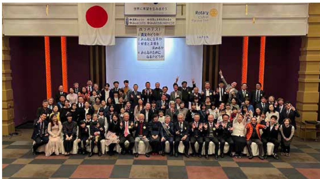
歳末家族会 (2023年12月18日)