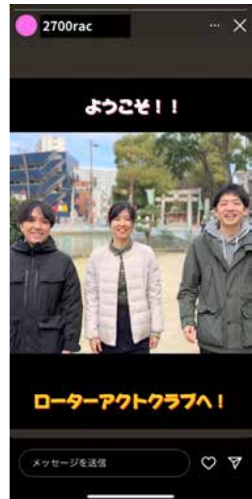
2月24日IMではPR動画を作成

2月24日、福岡市の西鉄本社ビルにて福岡市・久留米市周辺の7クラブと八幡ローターアクトクラブ主催でインターシティーミーティングを開催しました。ローターアクトの広報活動を主軸に、チームに分かれ、1分間のCMをそれぞれ作成しました。3時間の中で、企画、撮影、編集までを完了しました。今後はSNSにて活用することで、広報、会員増強を目指します。ローターアクトを深く考えることができ、課題を解決する充実したプログラムでした。