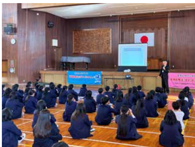
薬物乱用防止教室