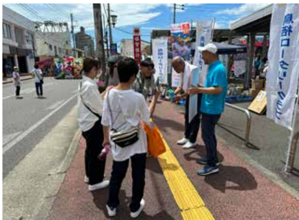
まつり鳥栖(ポリオ募金 IAC参加)