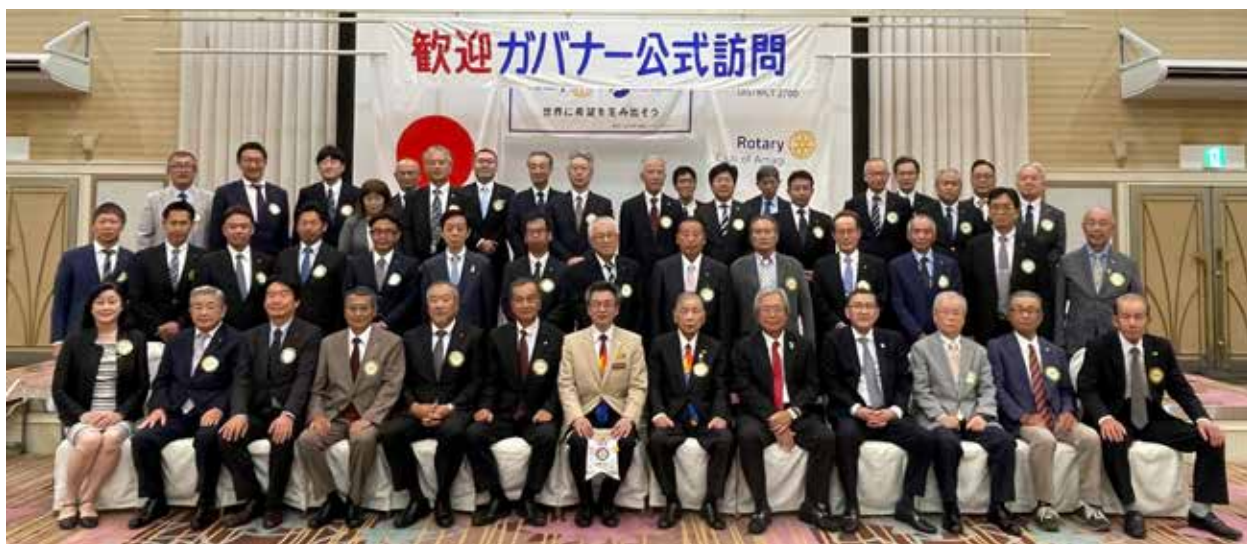
公式訪問時集合写真