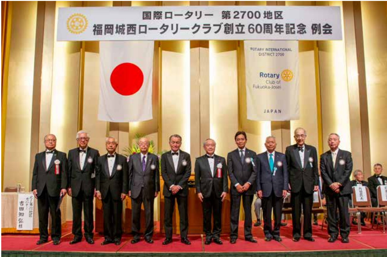
第50代～第60代歴代会長

令和6年1月30日(火)、福岡城西ロータリークラブ創立60周年記念例会・記念祝賀会が、ホテルオークラ福岡にて盛大に開催されました。