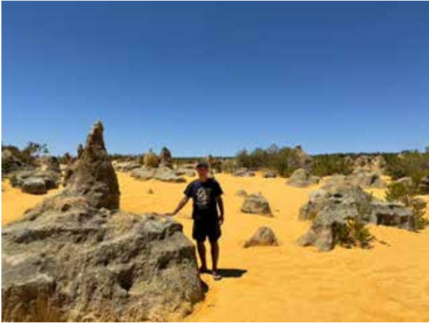
ナンバレ国立公園砂漠_気温44℃