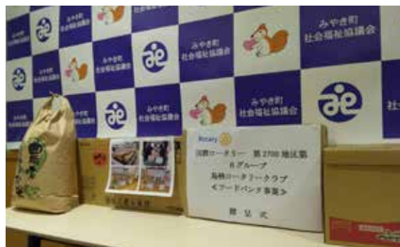
フードバンク事業