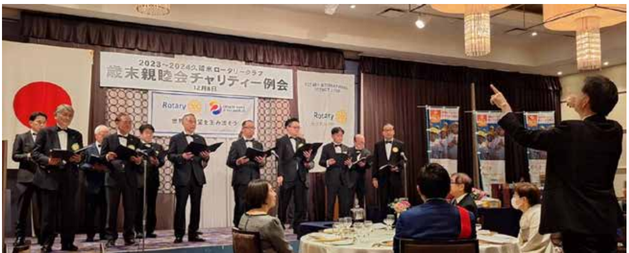
歳末親睦会チャリティー例会 —— 歳末例会時に出演した、アウトオブバース（ロータリー合唱団）