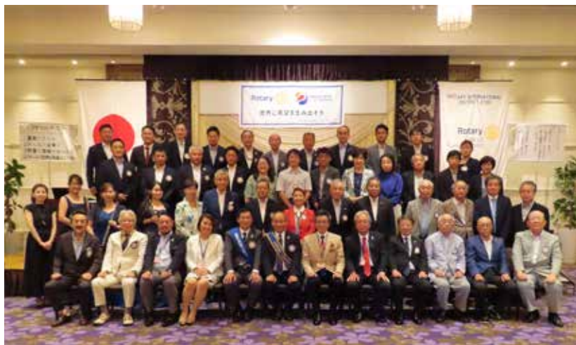
吉田ガバナー公式訪問（2023年8月31日）