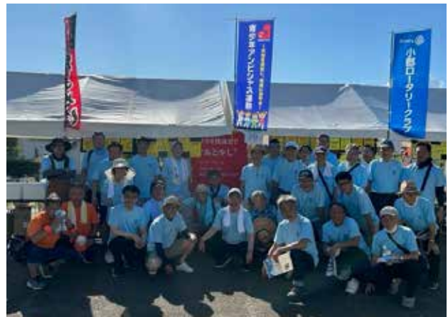
夢HANABI集合写真 2023年8月11日