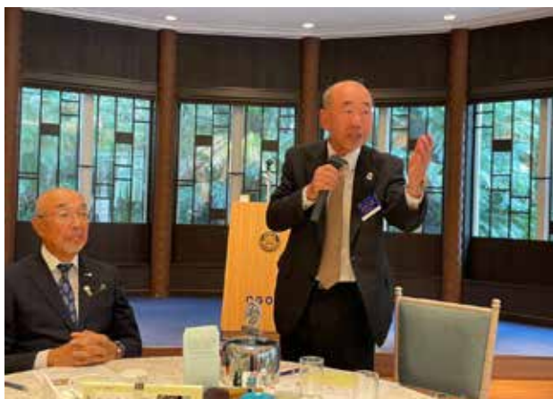
クラブフォーラムを開催! 2023年10月16日