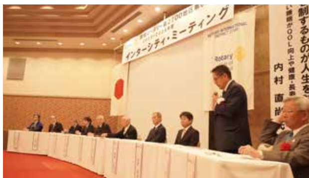
第6グループロータリアンによるパネルディスカッション