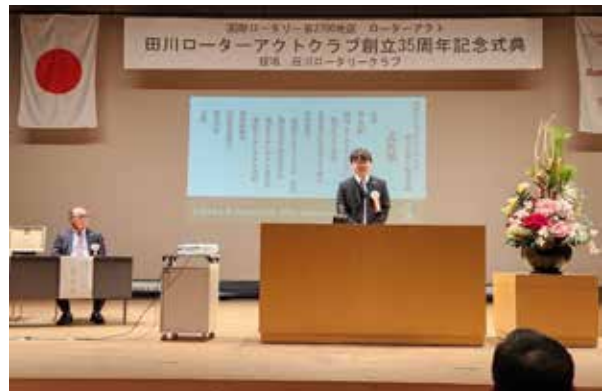
田川ローターアクトクラブ創立35周年式典