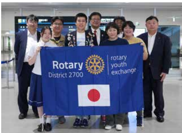
青少年交換プロジェクト