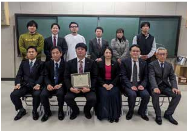
若松ローターアクトクラブ公式訪問

2月22日、若松生涯学習センターにて若松ローターアクトクラブの地区ローターアクト代表公式訪問を開催しました。「国際関係論」を学ぶことを趣旨にグループワークやゲームなどを通じた例会でした。現在同クラブは3人と少人数ながらも、非常に充実した内容であり、今期最後の公式訪問を締めくくるにふさわしい内容でした。