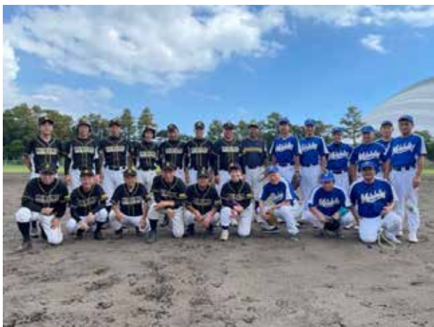
ロータリー野球大会 宮崎大会