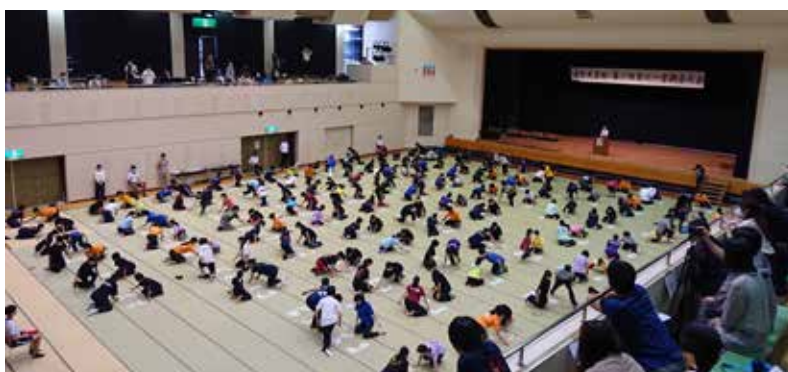
「百人一首朝倉大会の様子」

また、本年度は、「秋の田の かりほの庵の 苫をあらみ わが衣手は 露にぬれつつ (天智天皇)」の百人一首筆頭歌が詠まれたゆかりの地ということにちなみ、この地で毎年開催されている百人一首朝倉大会への支援を行いました。いずれも地区より補助金を頂き事業を遂行してまいりました。