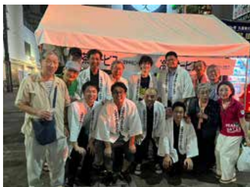
久留米水の祭典・冷茶サービス