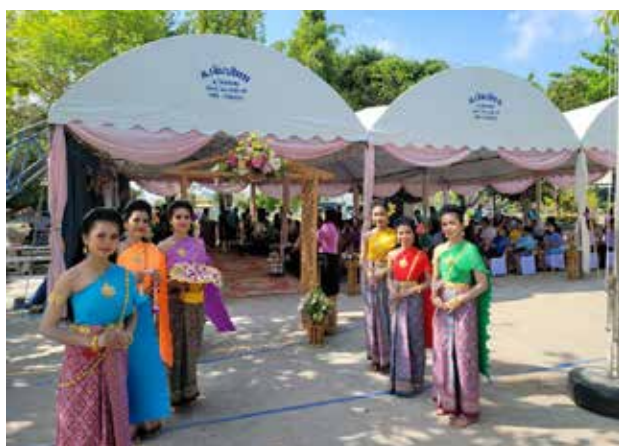
タイ国学校支援(式典風景)