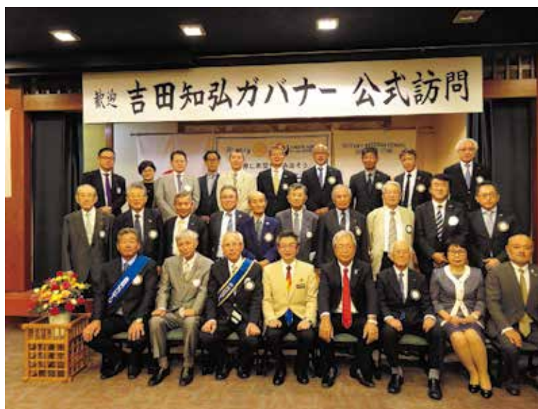
クラブ会員集合写真(ガバナー訪問時)