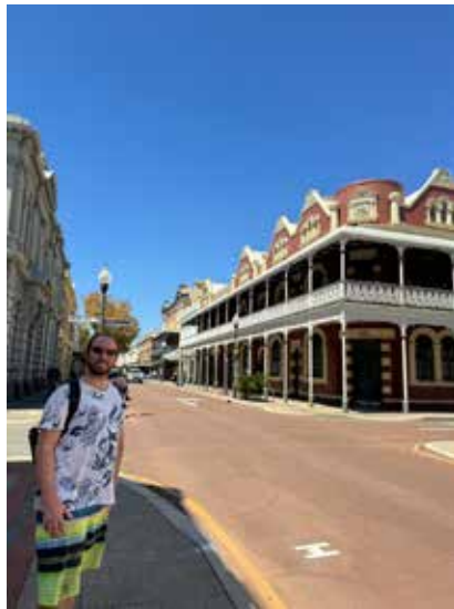
フリーマントル街並み